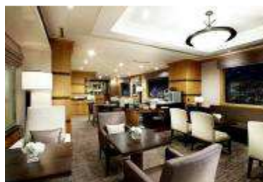
エグゼクティブラウンジ